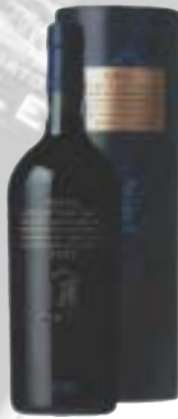
Calém Special Reserve Porto